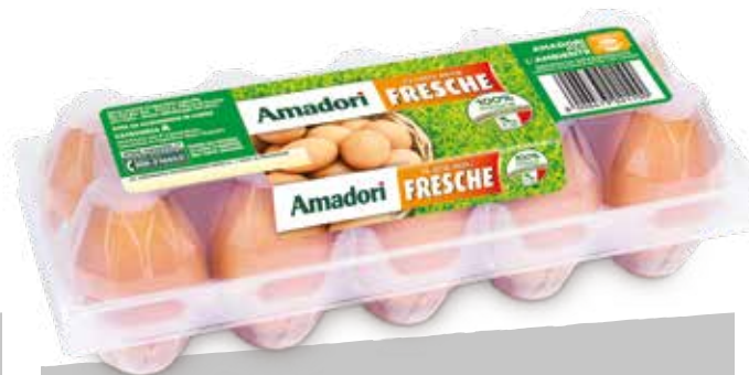
Uova medie x10