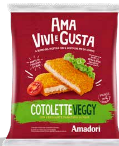
Cotolette Veggy SR FS 3kg ITA M