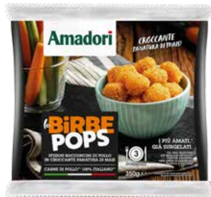
Birbe POPS 350g