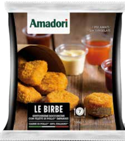
Birbe 700g sram