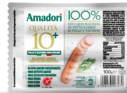
Wurstel 100% pollo/tacchino multipack