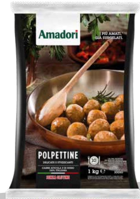
Polpettine Surg 1kg