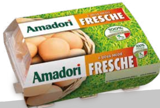
Uova medium 53/63 gr. x6