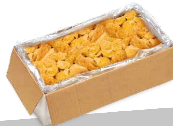
Pollo Fritto 10+AF 2,5kg sur S