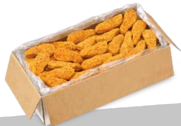
Mucho gusto fil imp sur 2,94kg S