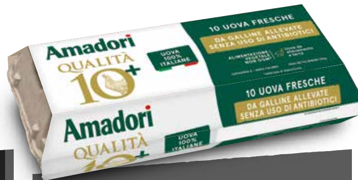
Uova fresche da allevamento a terra x10 AF