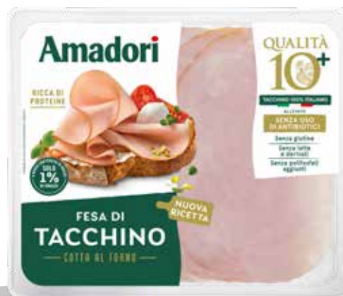
Arrosto fesa tac fet 10+AF 100