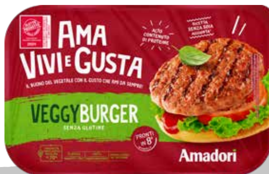
Veggy Burger AVG 200g