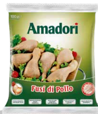
Pol fusi sur iqf 1kg