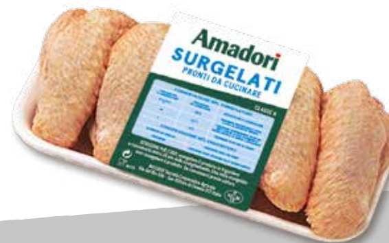
Pol ali c-fam sur a