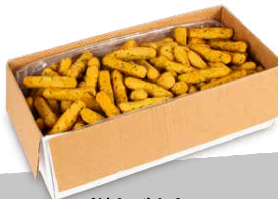
Chicky stick sf sur S