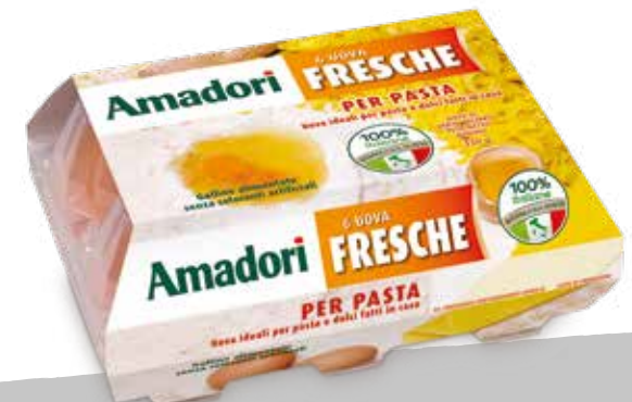
Uova 350g per pasta amadori