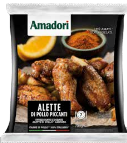
Alette piccanti gr.350 sram