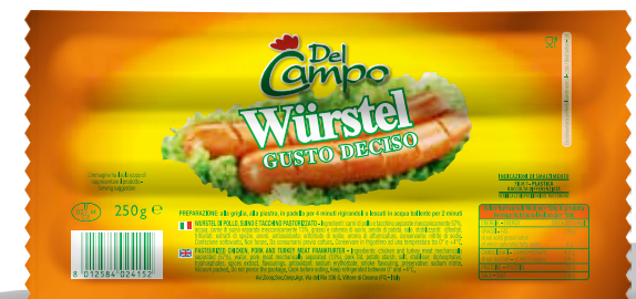
Wur Misto GustoDeciso 100g DLC