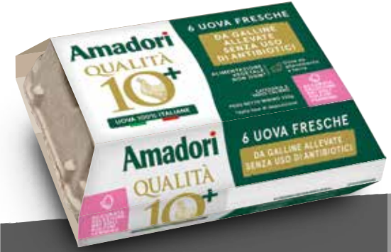
Uova fresche da allevamento a terra x6 AF pulcino femmina