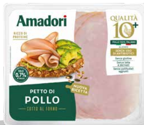
Arrosto pet pol fet 10+AF 100g