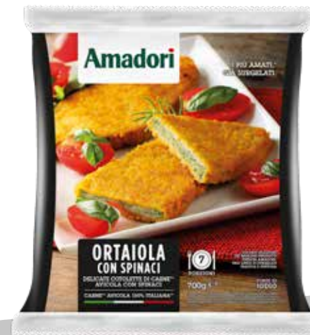
Ortaiole spinaci gr 700 sram