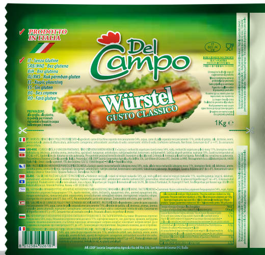
Wurstel pol tac 1kg DLC