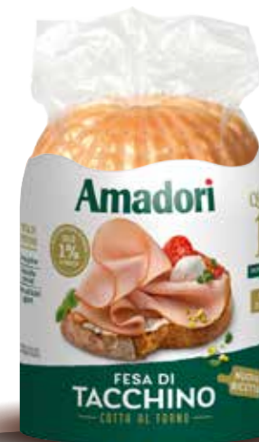
Arrosto di fesa di tacchino