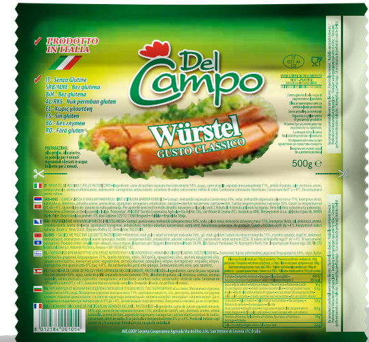
Wurstel pol tac 500g DLC