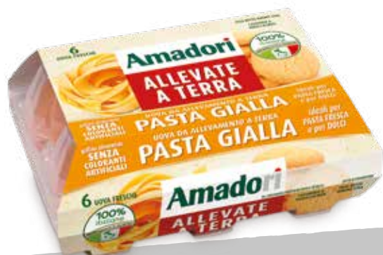
Uova 330g gialle x6 per pasta