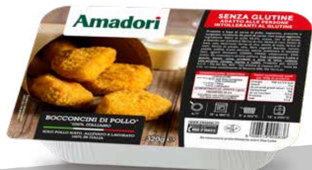
Bocconcini di pollo