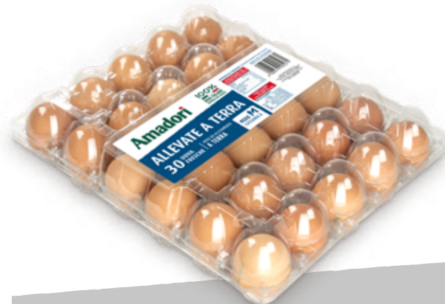
Uova M 8 cf x30 ama terra