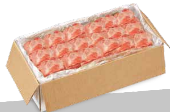
Agnello spalla porz. sur