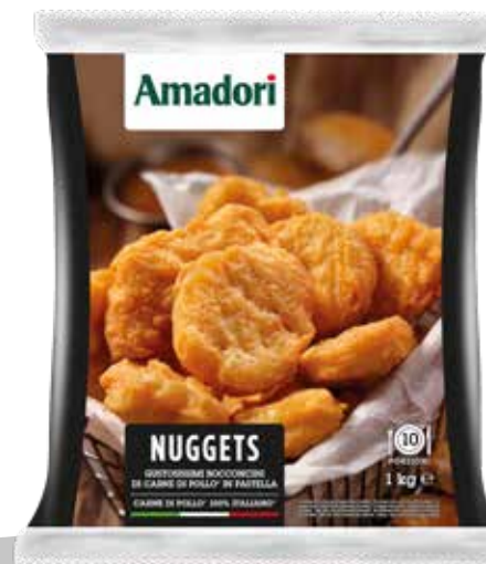
Nuggets pastel AMA 3kg sr