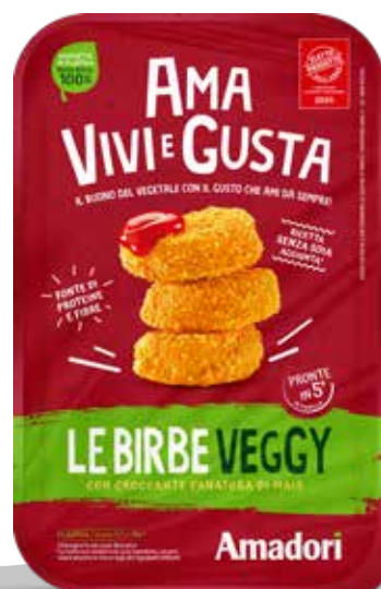
Le Birbe Veggy AVG 200g