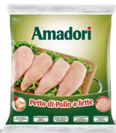
Pol pet fet sur iqf 700gr