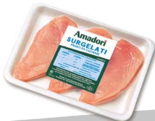
Pol petto fette sur ama