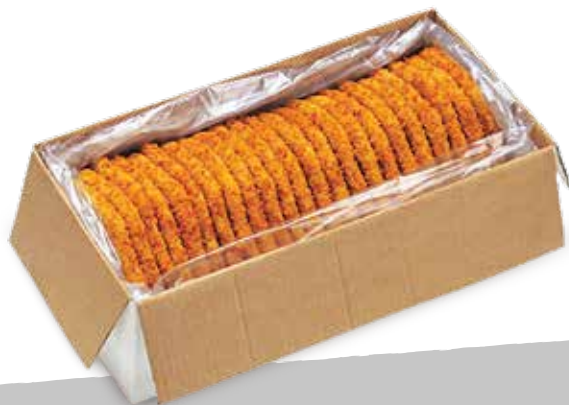
Filetti p imp kg3 sur S