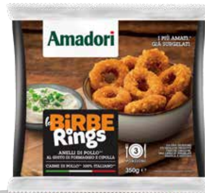
Birbe Rings Surg 350g