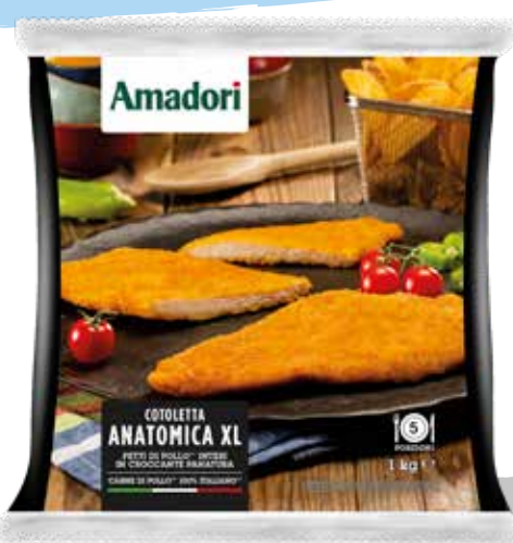
Cotolette pollo anat XL sr 1kg