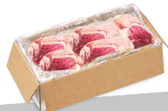
Suino stinco metà cong