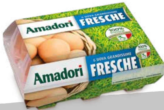
Uova extra large x6