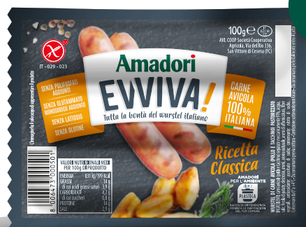
Wurstel 100% pollo/tacchino multipack