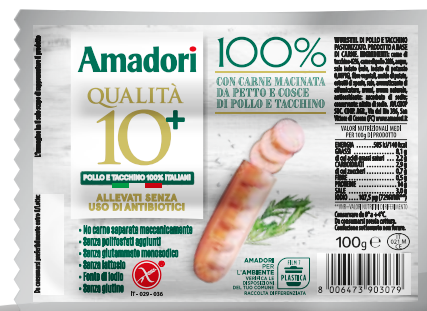
Wurstel 100% pollo/tacchino