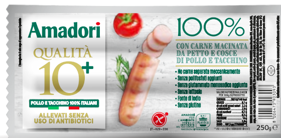
Wurstel 100% pollo/tacchino