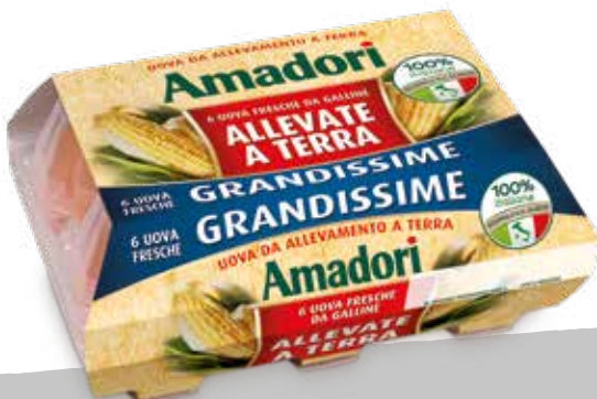
Uova fr a terra x6 XL