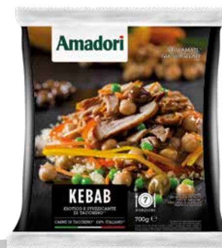
Kebab 350g sram