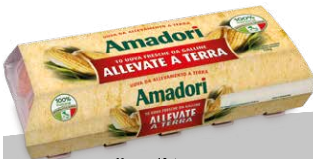
Uova x10 terra