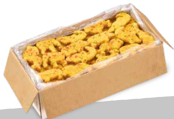
Birichini fil.p.imp. sur 3kg S