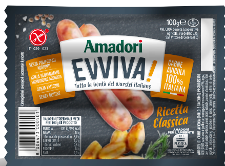
Wurstel Evviva pollo/tacchino