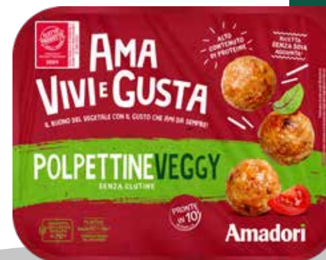
Polpette Veggy AVG 200g