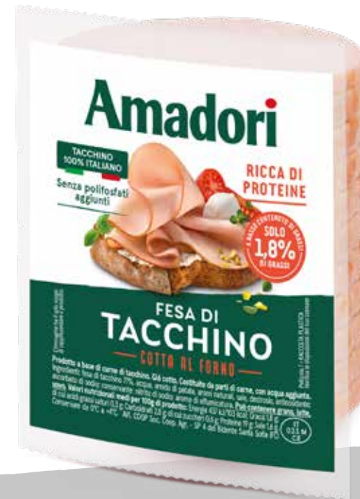
Arrosto di petto di tacchino