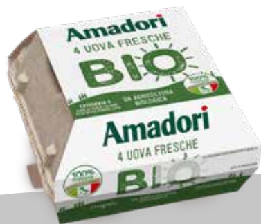
Uova fresche x4 BIOLOGICHE