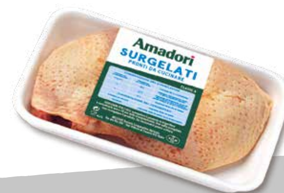
Pol b cosce x6 cfam sur a