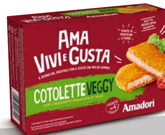
Cotolette Veggy AVG ast sur 220g