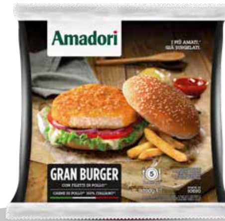
Gran Burger 700g std