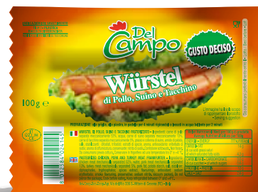
Wur Misto GustoDeciso 100g DLC