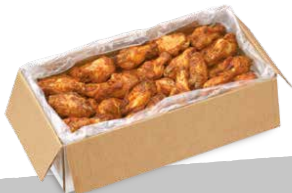
Buf. wings pic kg 2,5 sram S