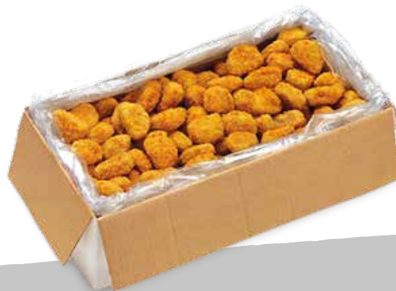
Filetti p imp kg3 sur S