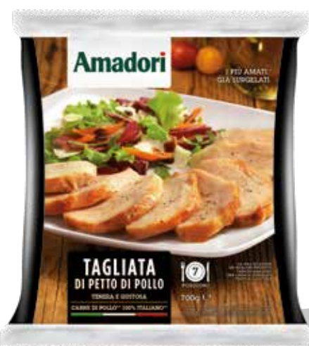
Tagliata di pollo 350g sram