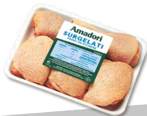
Pol spezzato cfam sur a