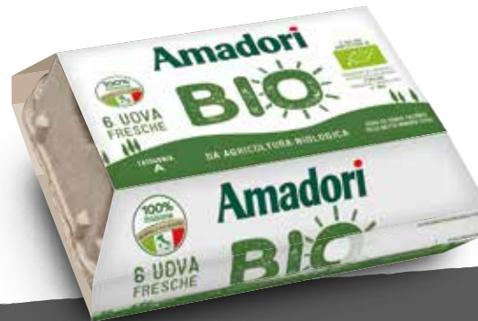
Uova fresche x6 BIOLOGICHE