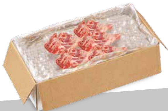
Agnello cosciotto sur