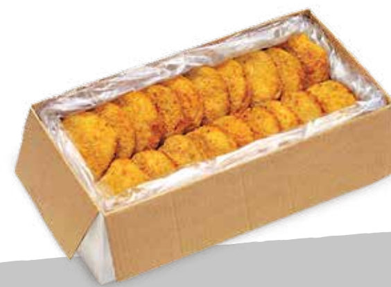
Cordon b p&f kg3 sr S