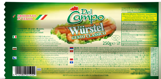
Wurstel pol tac 250g DLC