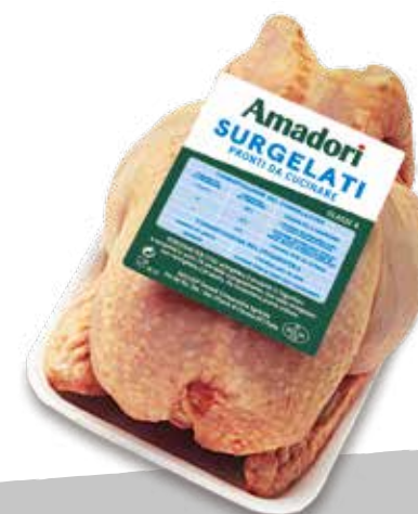
Pol busto cfam sur a