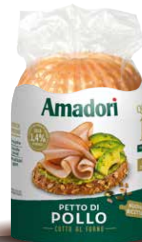
Arrosto di petto di pollo