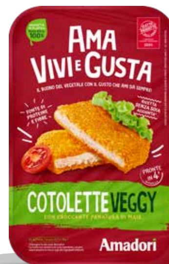
Cotolette Veggy AVG 200g