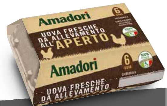
Uova fresche da allevamento all'aperto