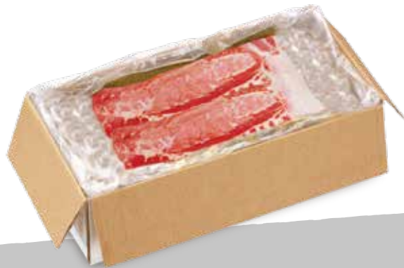
Suino filone estero surg