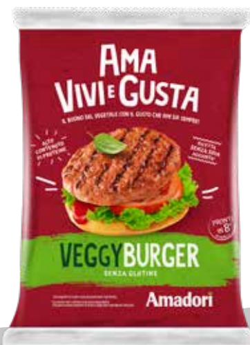
Veggy Burger SR FS 3kg ITA M