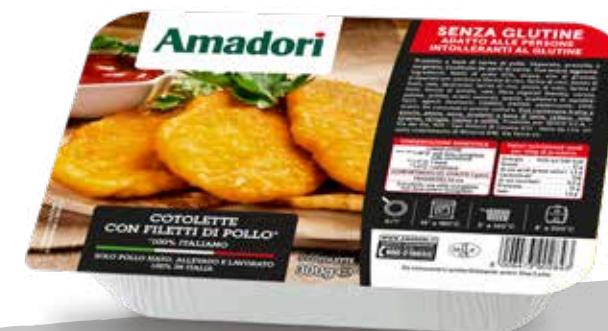
Cotoletta di filetti di pollo