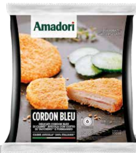
Cordon b p&f gr.750 srama