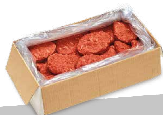
Hamburger bov.surg sf S