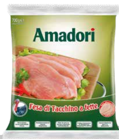
Tac fes fet sur iqf 700gr