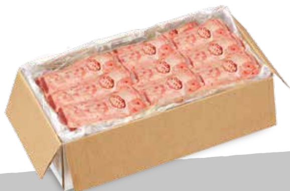
Agnello carrè cong