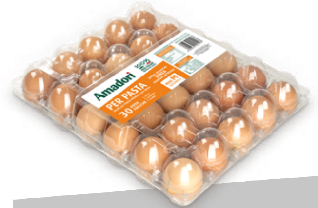
Uova M 8 x30 per pasta