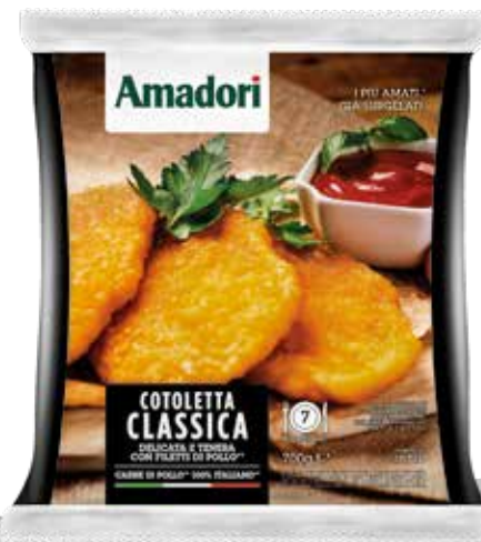
Cotoletta c/fil pol gr700 sram