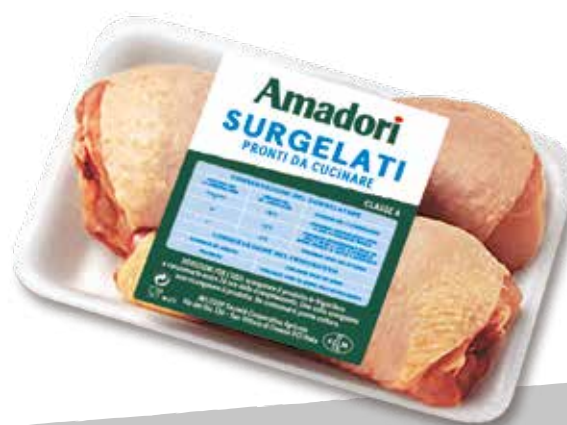
Pol fusi cfam sur a