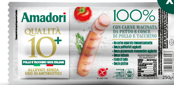
Wurstel 100% pollo/tacchino 250g x3