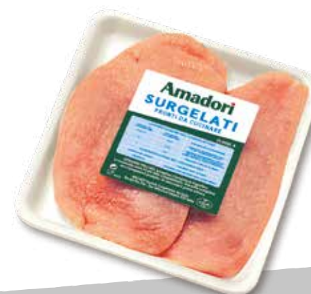
Tac fesa fette cfam sur a