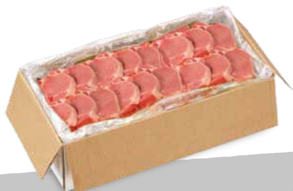
Suino braciole 180 cong