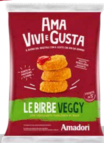
Le Birbe Veggy SR FS 3kg ITA M