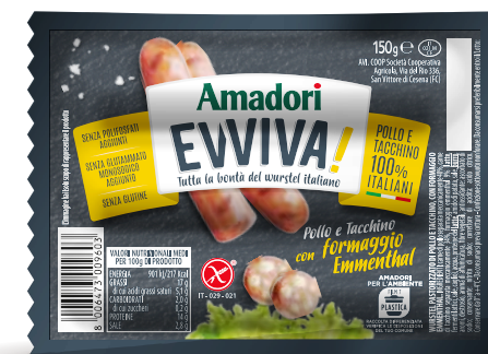
Wurstel Evviva pollo/tacchino al formaggio