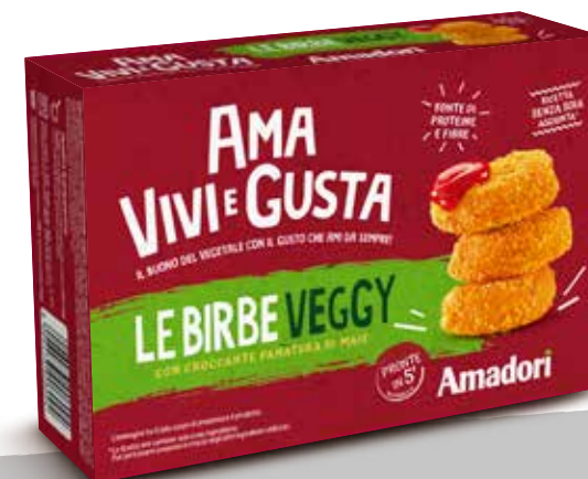
Le Birbe Veggy AVG ast sur 220g