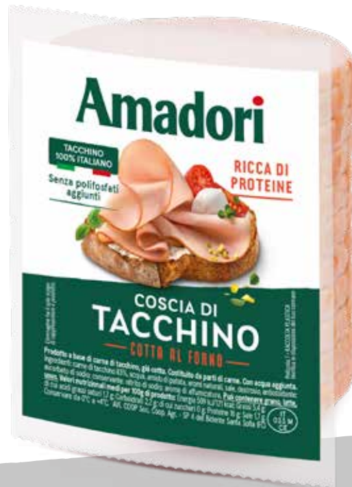
Arrosto di coscia di tacchino