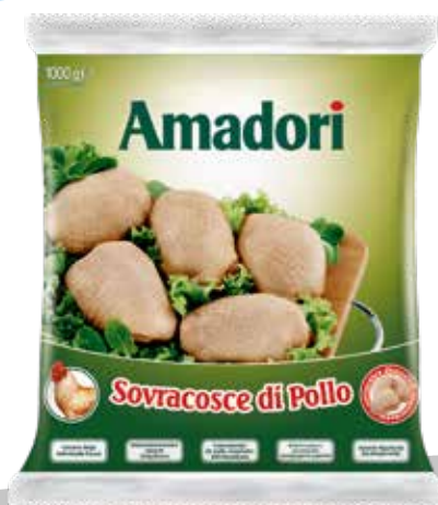
Pol sovr sur iqf 1kg