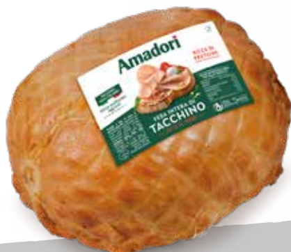
Pagnottella fesa intera di tacchino arrosto T