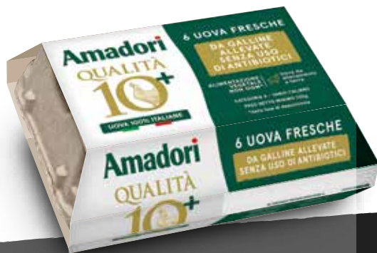
Uova fresche da allevamento a terra x6 AF