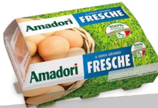
Uova large 63/73 gr. x6