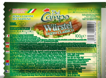
Wurstel pol tac 100g DLC