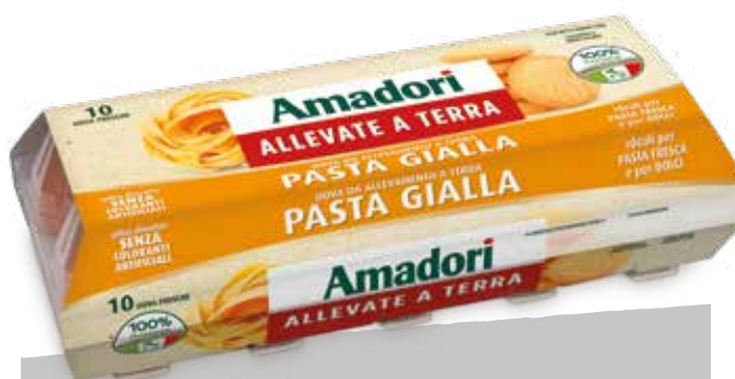
Uova 330g gialle x10 per pasta