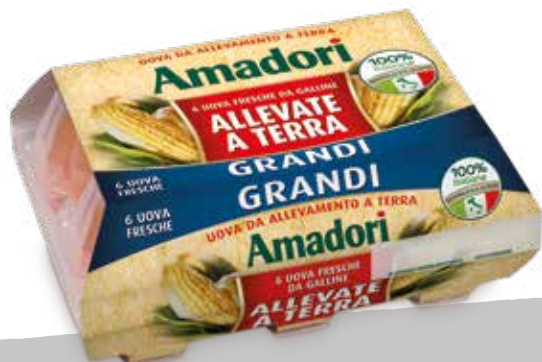
Uova fr a terra x6 L